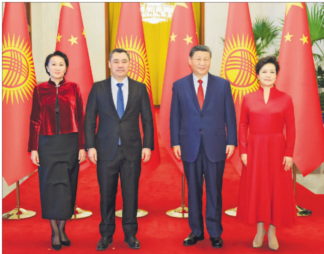
2月5日上午，国家主席习近平在北京人民大会堂同来华进行国事访问的吉尔吉斯斯坦总统扎帕罗夫举行会谈。这是习近平和夫人彭丽媛同扎帕罗夫和夫人扎帕罗娃合影。