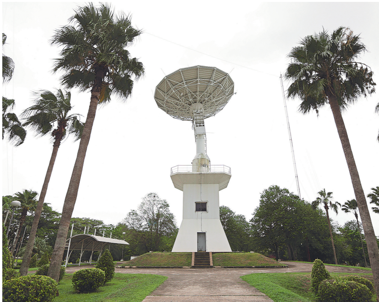
▲近日在泰国是拉差县拍摄的泰国地理信息学与太空技术发展局地面站。