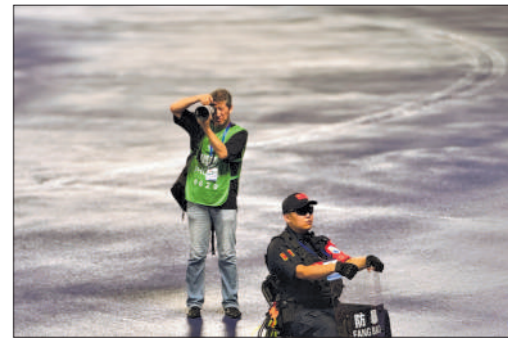
7月19日晚,在江苏省如皋市,南通报业传媒集团记者许丛军拍摄“苏超”第七轮南通队主场迎战盐城队的比赛。